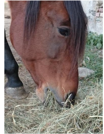
Nov 2015 – somministrazione fieno asciutto trattato con EM. Pelle sana e nessun problema respiratorio.