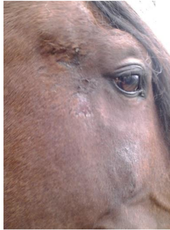
Nov 2014 – somministrazione di fieno bagnato (nonostante ciò è presente una evidente dermatite allergica).

Con i Microrganismi Efficaci anche i cavalli allergici possono continuare a mantenere il solito stile di vita e un'alimentazione senza stress e a basso costo. Oltre al trattamento standard per gli ambienti in cui gli animali vivono, è sufficiente trattare anche il loro fieno prima che venga imballato.